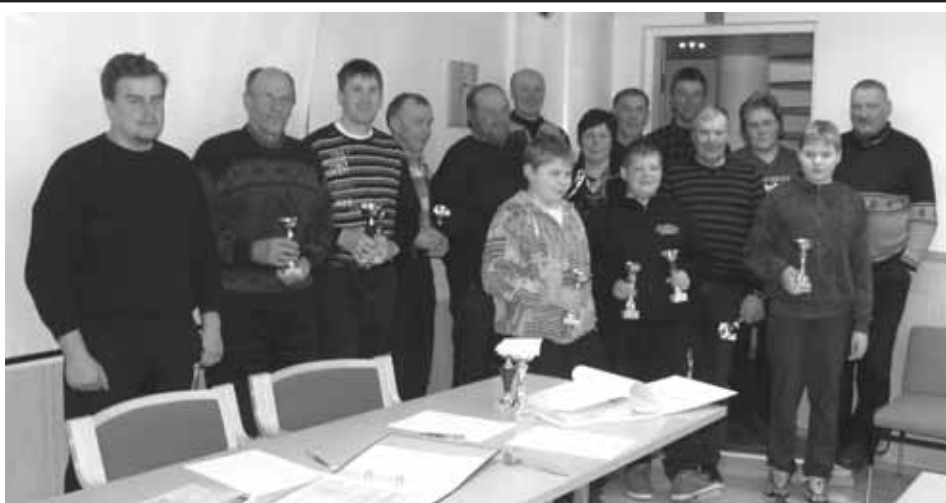
LeUK:n vuosikokouksessa keväätalvella 2014 stipendein ja pytyin palkitut edellisuoden kisoissa menestyneet LeUK:n kilpailijat