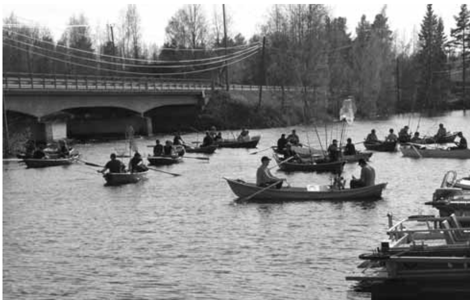
Vuoden 2013 OP-Pohjola soutu-uistelun cupin Suninsalmen osakilpailun lähtömerkkiä odotellaan.